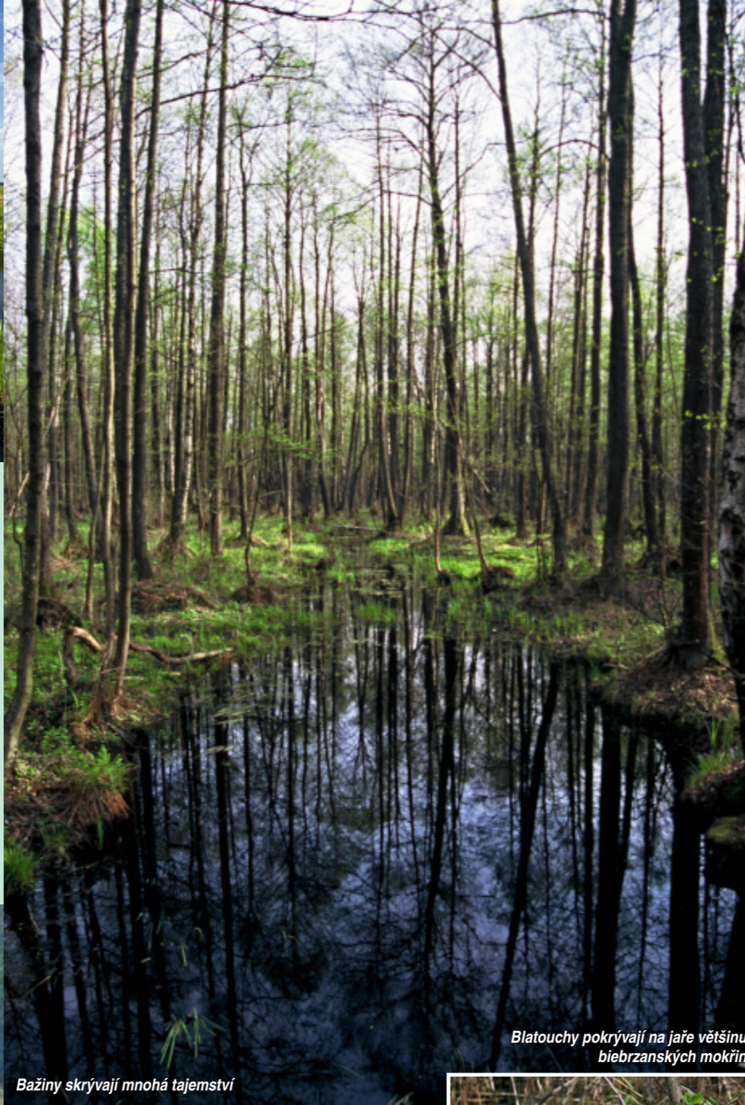
Blatouchy pokrývají na jaře většinu biebrzanských mokřin