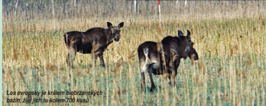
Los evropský je králem biebrzanských bažin, žije jich tu kolem 700 kusů